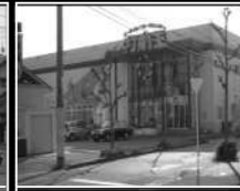
スポーツアミューズメント打撃場 徒歩5分