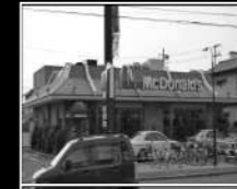
マクドナルド 徒歩7分