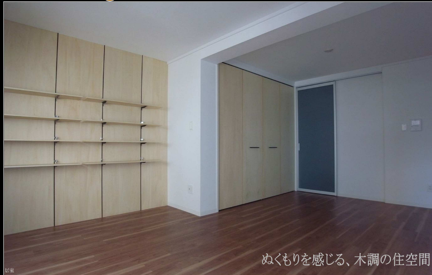
ぬくもりを感じる、木調の住空間