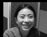
デザイン 長山潤子