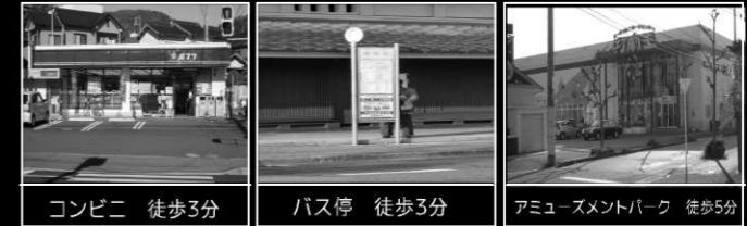
コンビニ 徒歩3分 バス停 徒歩3分 アミューズメントパーク 徒歩5分