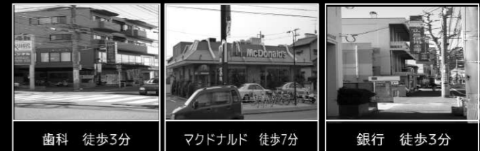
歯科 徒歩3分 マクドナルド 徒歩7分 銀行 徒歩3分