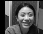
デザイン 長山潤子