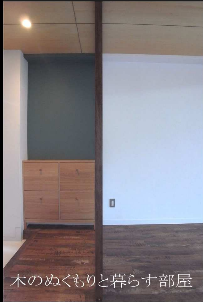
木のぬくもりと暮らす部屋