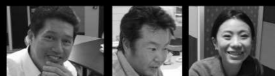
営業 土井真一郎 施工 西村友博 デザイン 長出潤子