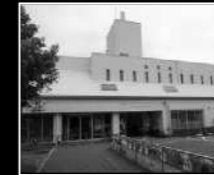
五日市公民館 徒歩1分