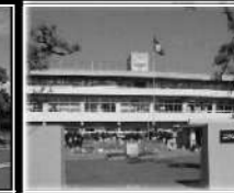
五日市小学校 徒歩3分